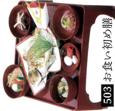
503 お食い初め膳 5,000円(税込5,400円)