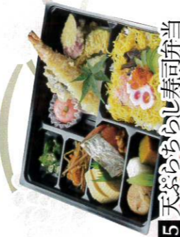
015 天ぷらちらし寿司弁当 1,250円(税込1,350円)