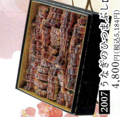
2007 うなぎのひのつばぶし【5人前】 4,800円(税込5,184円)