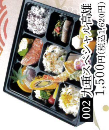
002 九重スペシャル高雄 1,500円(税込1,620円)