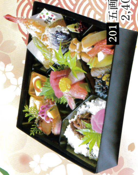
021 五画幕ノ肉 2,400円(税込2,592円)