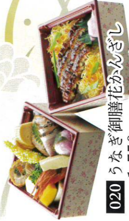
020 うなぎ御膳花かんざし 1,750円(税込1,890円)