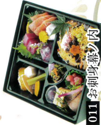
011 お刺身幕ノ肉 2,000円(税込2,160円)