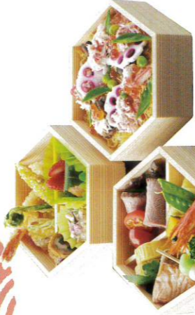
135 かじとイクラの春みやび 2,500円(税込2,700円)