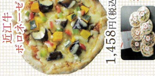
近江牛 レンコンキンピラ 伊吹 コーン ミーチョの ポロネーゼ 大葉の香り ベニコンチーズ ツナマヨ マルゲリータ

1,458円(税込) 1,350円(税込) 1,080円(税込) 1,026円(税込) 993円(税込)