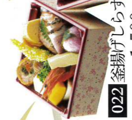
022 釜揚げしらすの花もよう 1,500円(税込1,620円)