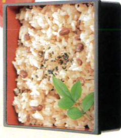
504 赤飯折詰 1,600円(税込1,728円)